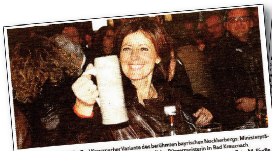
Hatte sichtlich Spaß an der Bad Kreuznacher Variante des berühmten bayrischen Nockherbersch: Ministerpräsidentin Malu Dreyer. Sie war von 1995 bis 1997 hauptamtliche Bürgermeisterin in Bad Kreuznach.