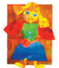
Förderverein Kinderklinik der Diakonie e. V.

Karnevalistenclub Fidele-Wespe 1899 e.V.